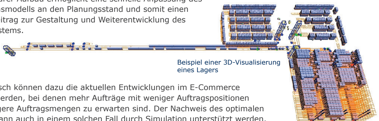
Beispiel einer 3D-Visualisierung eines Lagers

Ein modularer Aufbau ermöglicht eine schnelle Anpassung des Simulationsmodells an den Planungsstand und somit einen aktiven Beitrag zur Gestaltung und Weiterentwicklung des Logistiksystems.